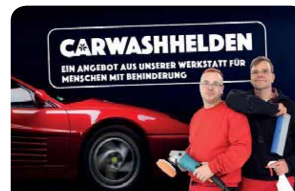
Ein Ausschnitt aus dem Flyer

In unserer Fahrzeugpflege in der Werkstatt „Am Flutgraben“ reinigen und pflegen wir PKWs und Kleintransporter. Seit Mai 2017 machen wir das und wir hatten dabei schon so manch schönes Erlebnis.