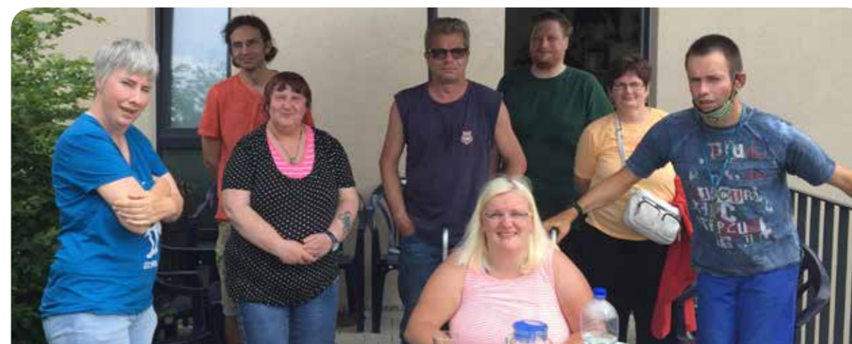
Die Vertreter des Lebenshilfe-Beirats Jena